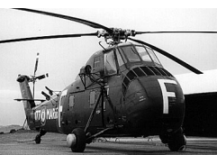
H-34 Mammouth Sikorsky (USA) 1954