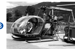
SE-3130 Alouette II SNCASE (F) 1955