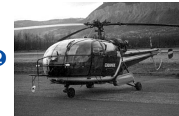
SA-319 Alouette III Sud Aviation (F) 1967