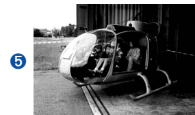
SA-341 Gazelle Aérospatiale (F) 1971