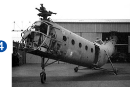
H-21 Banane volante Piasecki (USA) 1952