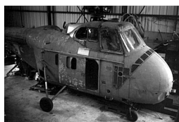
H-19 Elephant joyeux Sikorsky (USA) 1949